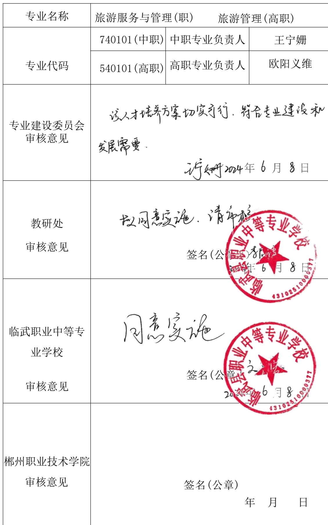
2024级三二分段人才培养方案制定审批表