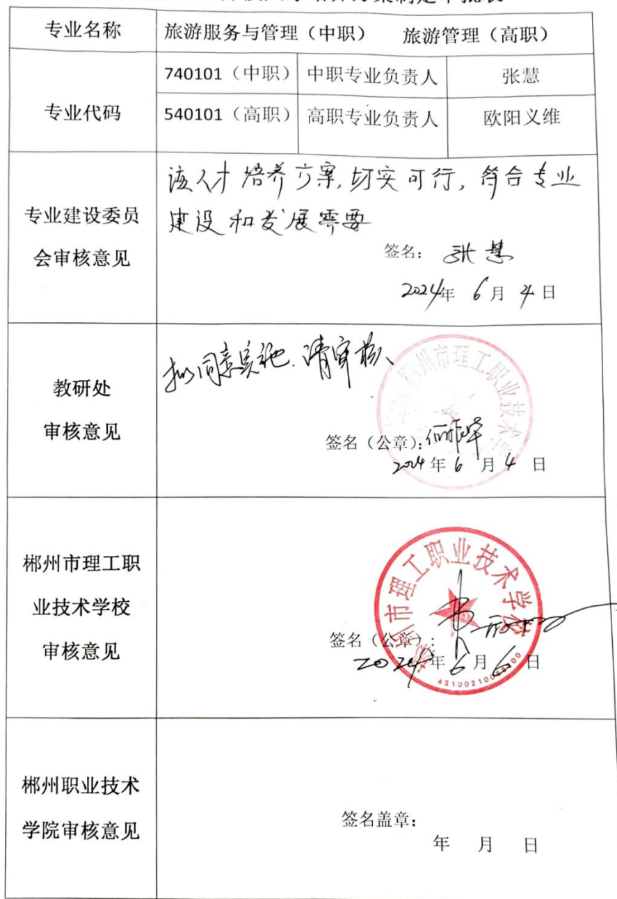
2024 级三二分段人才培养方案制定审批表