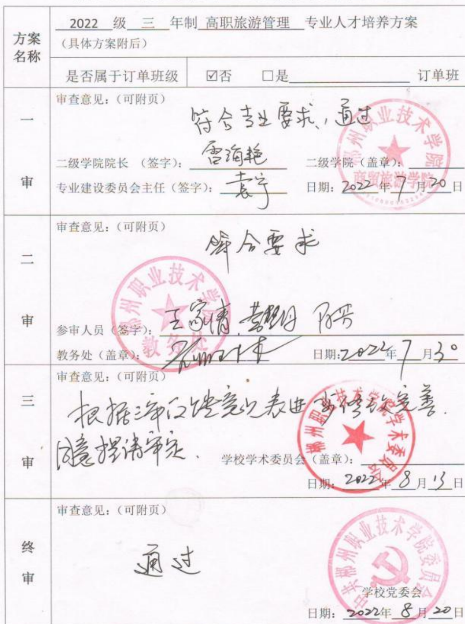
郴州职业技术学院专业人才培养方案制定审批表