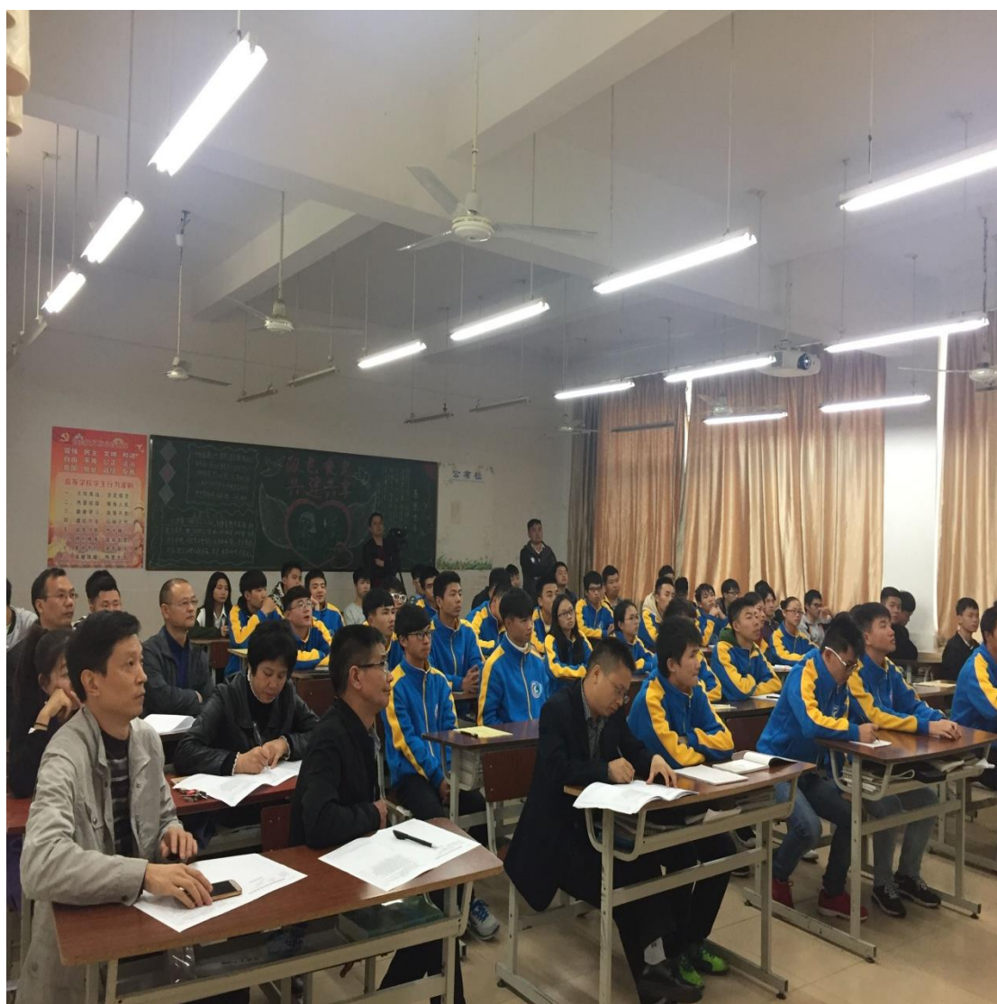
台下认真听课的老师和同学们

他们一边使用多媒体为同学们进行中英文的授课，一边拿出从工厂里带来的模具零件为同学们生动的演示，介绍当下企业最先进的模具理论和模具技术。讲台下，同学们都听得津津有味，课后争先恐后的问老师问题，同时表示期待工程师们下一次的授课。系里来听课的专业课的老师们都认真的做笔记，课后也积极地与这两位工程师进行交流。